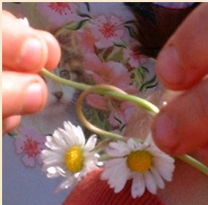
Investeer in jezelf