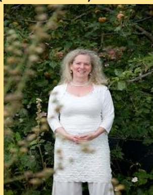
Begeleiding: Rangeeni de Gruijter